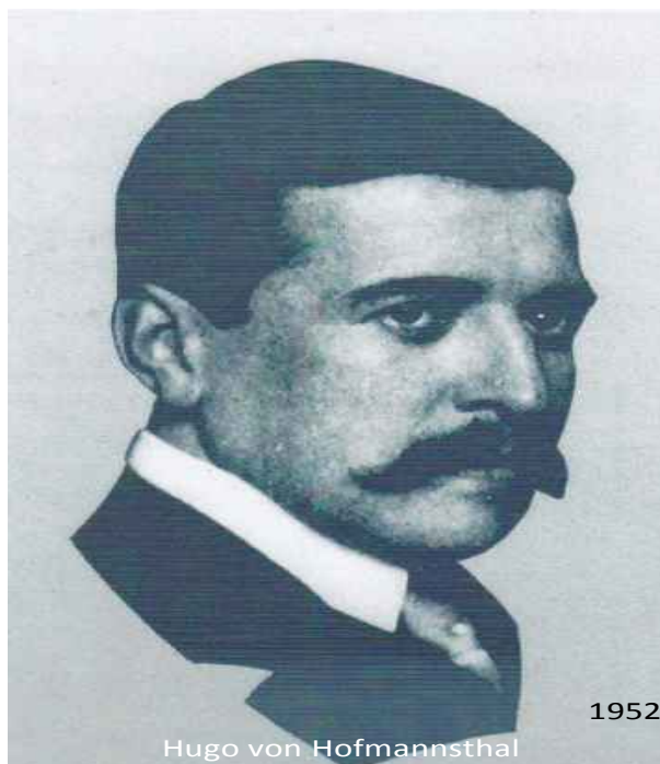
Hugo von Hofmannsthal

Stykkets forfatter Hugo von Hofmannsthal blev født i Wien i 1874, gik på Wiener Akademisches Gymnasium og var en ung intellektuel. Hans første værker var allerede meget modne, og man troede ikke at forfatteren ”Loris” kun var en 16 år gammel student. I 1911 opførtes ”Jedermann”, men det fik dårlige anmeldelser. I 1920 blev stykket genopført i Salzburg og blev nu meget populært