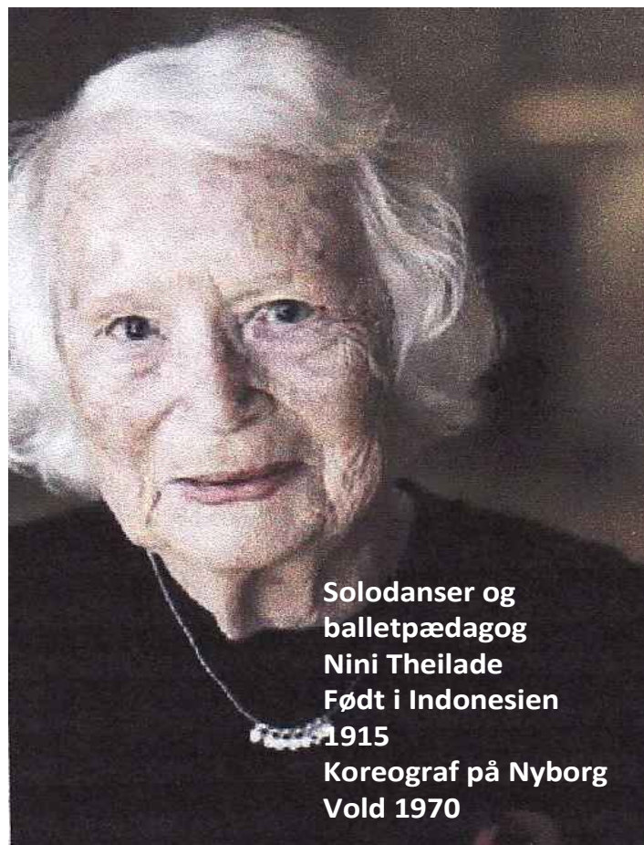
Solodanser og balletpædagog Nini Theilade Født i Indonesien 1915 Koreograf på Nyborg Vold 1970