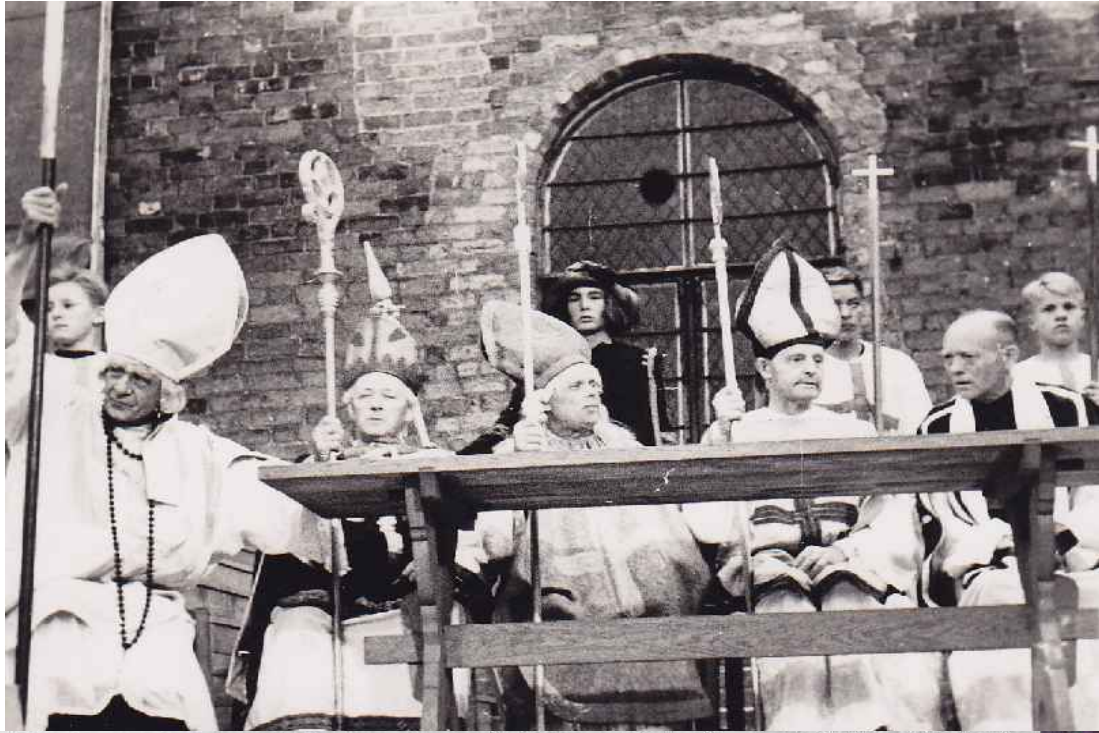
Den festlige Afslutning paa det 10 og en halv Time lange Danehofspil. I Finklers og Kerters Skær kaares Valdemar Atterdag til Danmarks Konge ved Danehoffet paa Nyborg Slot Aar 1340, efter at Niels Ebbesen har dræbt den kullede Greve i Randers.