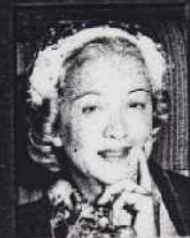
En af de store komikere i Danmarks teater

THIT JENSEN OG VALDEMAR ATTERDAG til Danehof i Nyborg Sd. 16-17