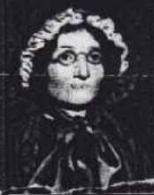
En af de store komikere i Danmarks teater

THIT JENSEN OG VALDEMAR ATTERDAG til Danehof i Nyborg Sd. 16-17