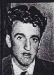
En af de store komikere i Danmarks teater