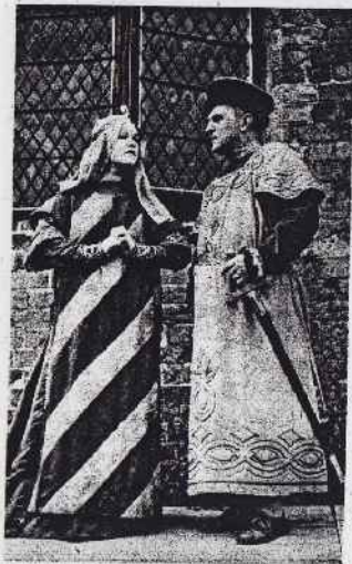
Den farlige gamle Oprører, Kong Valdemar Atterdags Fjende Nr. 1, Høvdingen Marsk Stig. Blandt Fjenderne var salig Niels Bugges Datter Margrethe, gift med en anden Oprører, Fredrik Lykke.