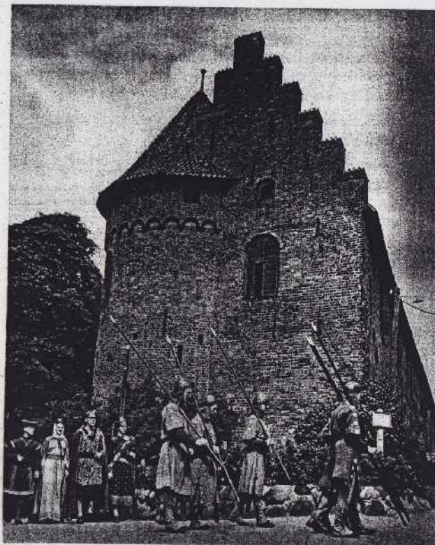
Det svære gamle Slot med de tykke Mure, bygget som uindtagelig Borg til Rigets Beskyttelse, det eneste, hvor paa den Tid 1354 Danehoffet samlede det hele Folket omkring deres Drot. Det anlagdes under Kong Valdemar den Første.