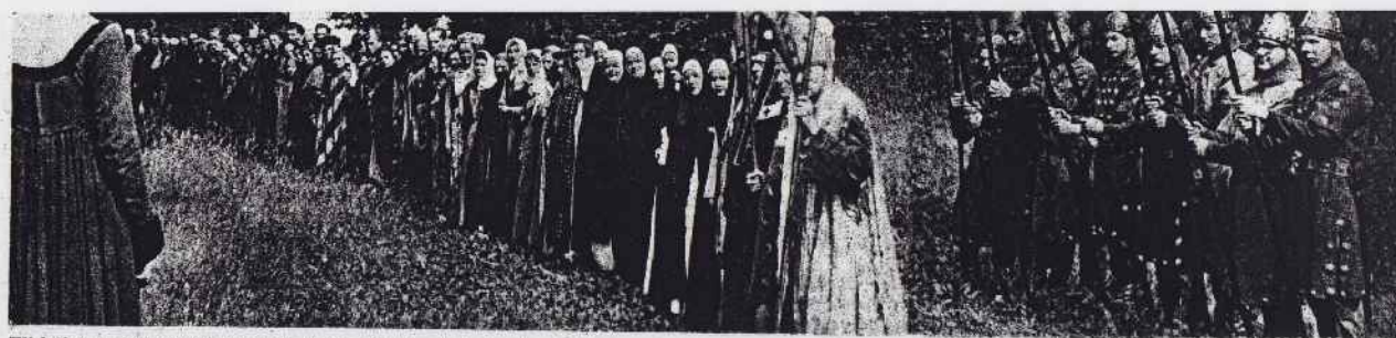
Til højre paraderer Kongens Livvagt de uforfærdede Knæber af Himmersyssel, een bestemt Æt; som havde svoret Kongen Troskab til Døden. Til venstre et Opbud af udsøgte Danehofdeltagere fra hele Landet — ved Det kgl. Teaters store Hjælpsomhed i de Antræk, som hørte Tiden til.