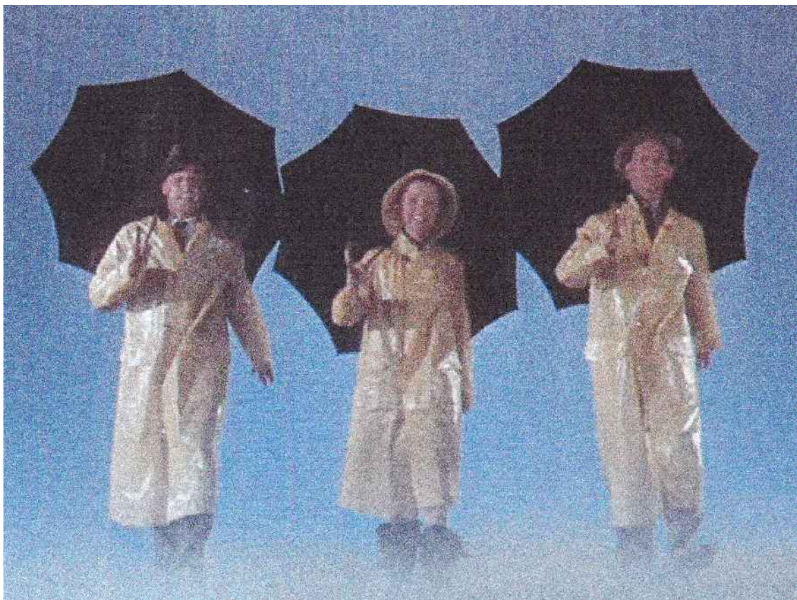
Amerikansk musicalfilm fra 1952 – Singin’ in the Rain Gene Kelly, Debbie Reynolds og Donald O’Connor

Sig navnet Gene Kelly og ekkoet lyder ”Singing in the rain” – og omvendt!