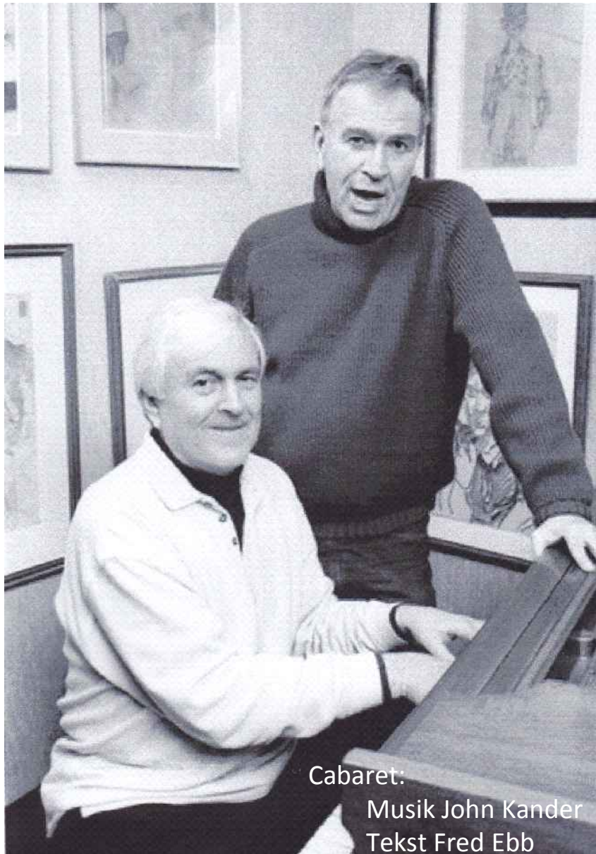
Cabaret: Musik John Kander Tekst Fred Ebb